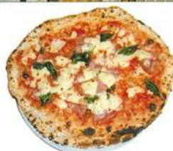
イタリア産ハム入りのマルゲリータ

たものを大きな石窯で焼いており、生地がもちっりして大変おいしいです。ワインも充実しており、特に白ワインとモッツアレラはよく合います。